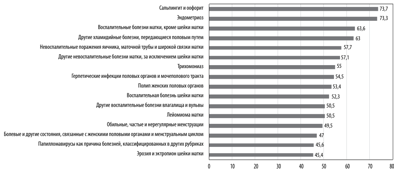
Рис. 2. Среднее значение \Sigma FSFI у исследуемых пациенток гинекологического профиля по заболеваниям (n=1235).