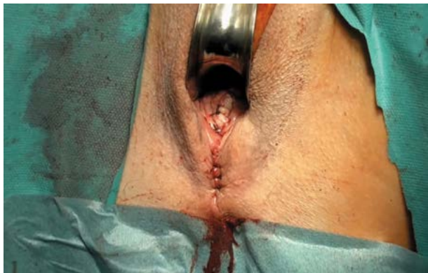
Рис. 3. Влагалищный лоскут фиксирован к передней продольной связке позвоночника на уровне мыса крестца.