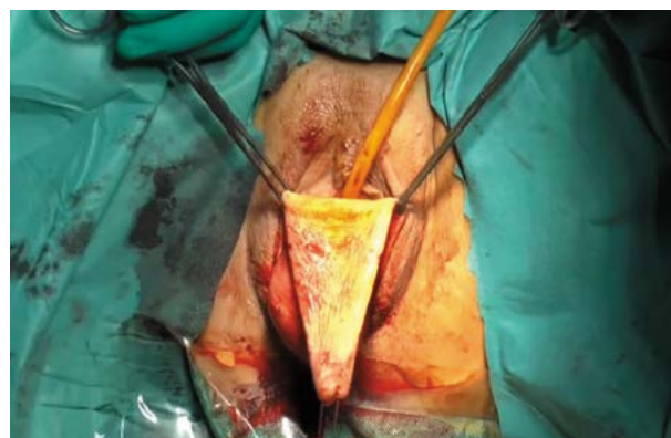
Fig. 1. Deepithelialized vascularized flap of the posterior vaginal wall.